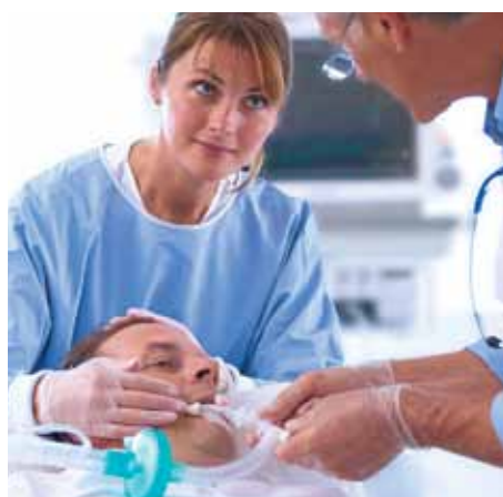
Инвазивный и неинвазивный режимы вентиляции для интенсивной терапии